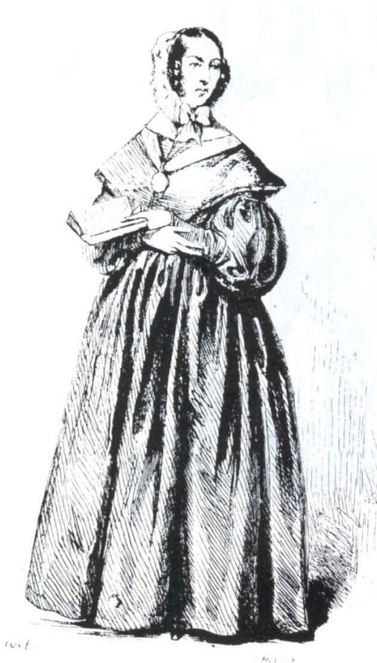
Surveillante à Saint-Lazare

« Si un arrêté du 25 décembre 1819 stipule que la garde des femmes devrait être confiée à un personnel féminin, il semble que cette disposition n'ait pas eu d'application immédiate en raison des difficultés de recrutement.