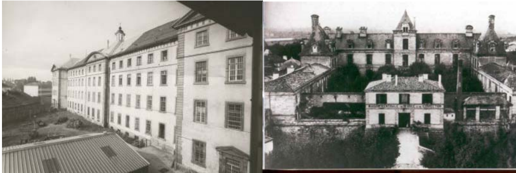
A gauche, la photographie représente la centrale d'Haguenau – A droite, la façade d'arrivée de la maison centrale de Cadillac, fin XIX e siècle.

Parmi les centrales, seules Clermont, Haguenau et Cadillac sont destinées pour les femmes seulement. Montpellier devient non mixte en 1825 avec le transfert des hommes à Nîmes et des femmes de Nîmes dans celle de Montpellier. Pour des raisons telles que l'exiguïté des lieux et la rigueur du climat, la centrale d'Embrun est réservée aux hommes et les femmes transférées à Haguenau.